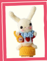
Lief klein konijntje