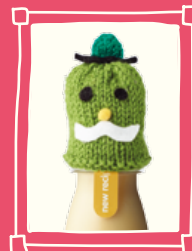
Fransman met snor